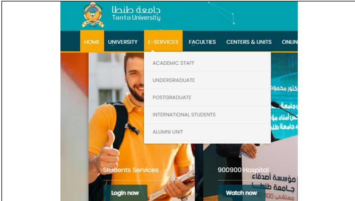
Electronic Services on Tanta University official site to reduce the use of Paper in Campus (Tanta University, Egypt)