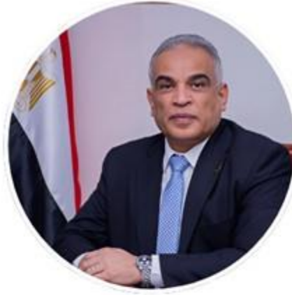
أ. د. / محمد حسين محمود رئيس الجامعة